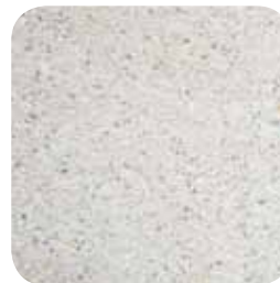
Gravillons lavés beige 4/10